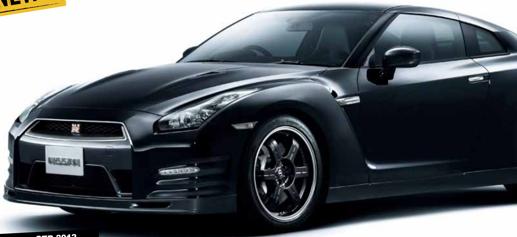
Nissan GTR 2012