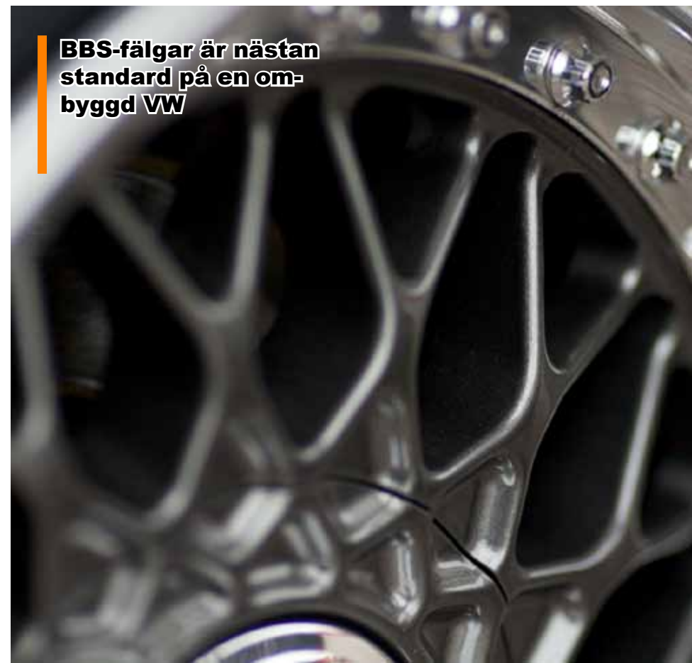
BBS-fälgar är nästan standard på en ombyggd VW