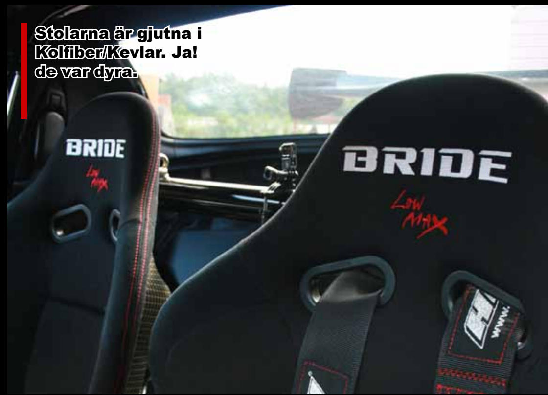
Stolarna är gjutna i Kolfiber/Kevlar. Ja! de var dyra.