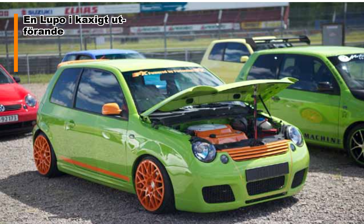
En Lupo i kaxigt utförande