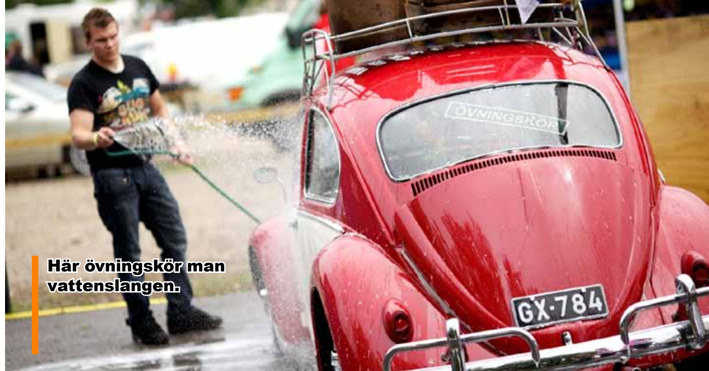
Här övningskör man vattenslangen.