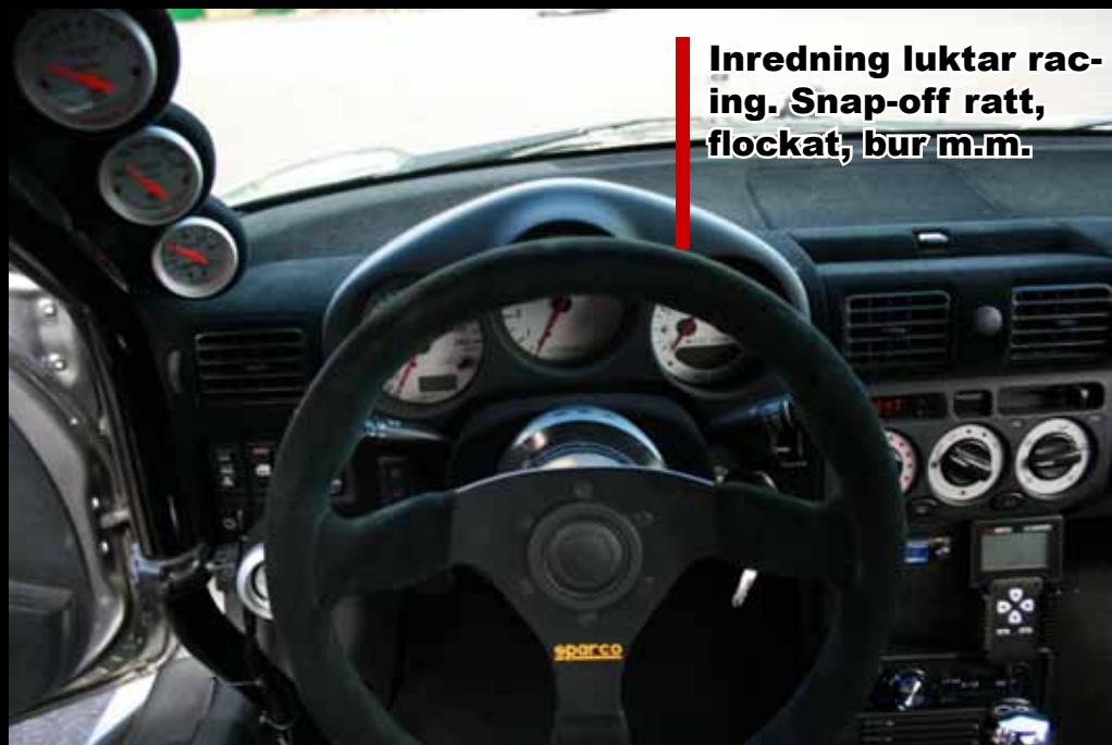
Inredning luktar racing. Snap-off ratt, flockat, bur m.m.